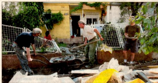
Romeltakarítás Veszprém dózsavárosi részében, a Cseri utcában a péntek esti pusztító vihar után

Tomádószerű vihar csapott le pénteken késő este a városra, a legnagyobb károkat a Vadvirág óvoda, a Kittenberger vadaspark, valamint a városban lévő volt közgazdasági szakközépiskola épülete szenvedte el, jelentette be hétfőn a polgármester. (Folytatás a 3. oldalon, Hatalmasak a viharkárok címmel.)